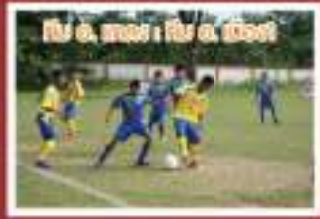
ทีม อ. หนอง : ทีม อ. หนอง