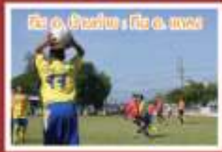
ทีม อ. อนุบาลฯ : ทีม อ. หนอง