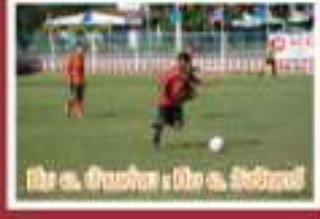
ทีม อ. หนอง : ทีม อ. หนอง

กระจององเจ้าข้าเอ๊ย! ฉบับนี้เรามาอัปเดต การแข่งขันฟุตบอลเยาวชนจังหวัดระยอง โครงการ “เอสซีจี เคมิคอลส์ ลีกเยาวชนชิงถ้วยพระราชทาน สมเด็จพระเทพฯ ปี3” หลังจากพาดแข้งผ่านไป แล้วครึ่งทาง จบเลกที่ 1 เราก็เห็นทีมที่อยู่หัว ตารางกันแล้ว โดยทีมเทศบาลเมืองมาตาตุ่ม มีคะแนนนำเป็นจ่าฝูง > 22 คะแนน ตามด้วย ทีมอำเภอปลวกแดง รองจ่าฝูง และทีมอำเภอ วังจันทร์ อันดับ 3 เอ๊ะๆ !! แต่ก็ไม่แน่น ทีมผู้ตาม ยังมีโอกาสแก้ตัวในเลกที่ 2 ยังมีส่วนมากกล่าวไว้ว่า “สงครามยังไม่จบ อย่าเพิ่งนับศพทหาร” โดยเฉพาะทีมอำเภอบ้านค่ายแชมป์ 2 สมัย ซึ่งตก ไปอยู่อันดับที่ 4 ในเลกนี้ ยังมีโอกาสดีคืนพลิก