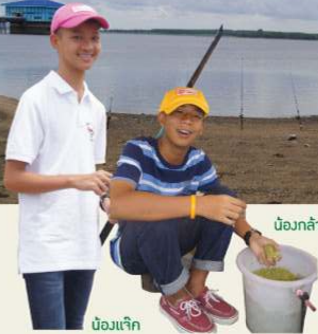
น้องกล้า