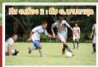
ทีม เอสซีจี 2 : ทีม อ. อนุบาลฯ