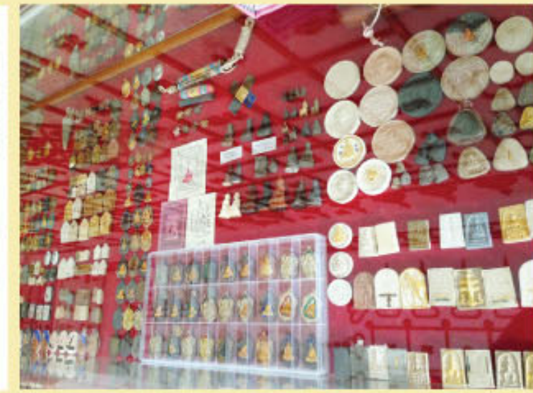
หลวงพ่อบุญธรรม มนุญโญ วัดหนองกรับ คิชฌิเอกหลวงปู่ทิม