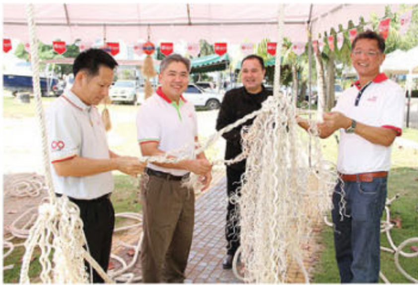
ผู้บริหารฯ ร่วมทำซั้งเชือก เพื่อเป็นแหล่งอนุบาลสัตว์น้ำ

กิจกรรมบ้านปลาจำลอง นับเป็นจุดเริ่มต้นและเครื่องมือสำคัญที่ช่วยส่งเสริมให้กลุ่มประมงพื้นบ้านเรือเล็กตระหนักถึงความสำคัญของการดูแลทรัพยากรธรรมชาติทางทะเล และมีจิตสำนึกรักษ์สิ่งแวดล้อมมากขึ้น