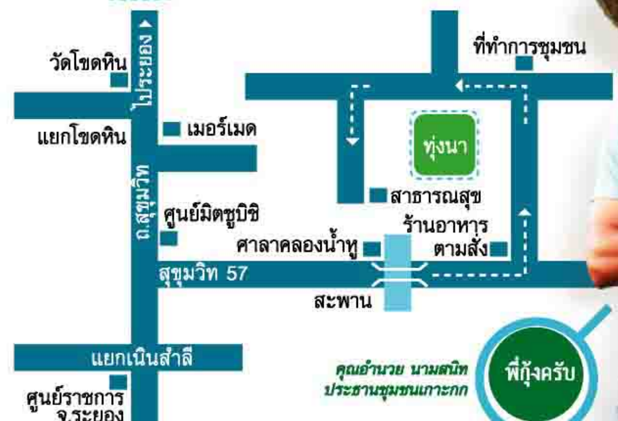
พี่กุ้งครับ

พี่ๆ น้องๆ ท่านใด สนใจมาเที่ยวแปลงเกษตรสาธิต หรืออยากอุดหนุนสินค้าในตลาดนัดวันเสาร์สิ้นเดือนของชุมชนเกาะกก สามารถเดินทางมาตามแผนที่นี้ หรือโทรตามทางพบได้ที่เบอร์ 080-6441803