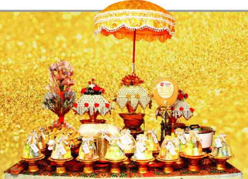
กำหนดการ

กฐิน...ประเพณีทำบุญของพุทธศาสนิกชน การทอดกฐินถือว่าเป็นอานิสงส์มาก เพราะเป็นกาลทาน คือ ทานจำกัดด้วยเวลา หนึ่งปีจะทำได้เพียงครั้งเดียว ภายในช่วงเวลา 1 เดือนหลังออกพรรษา